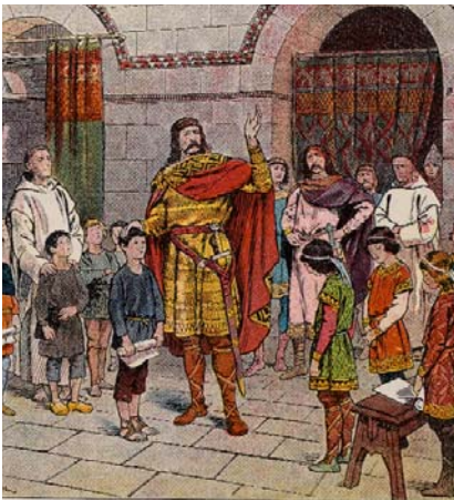
Histoire de France. Premier livre (des origines à 1610), par A. Aymard. Ill. J. et L. Beuzon, 1933. BNF, Philosophie, Histoire, Sciences de l'homme, L39-1129

salvateur, alors que le grand homme est celui du temps cumulatif, où s'empilent les résultats d'une longue patience et d'une énergie quotidienne. Surtout, le héros est l'homme de l'exploit spécialisé, notamment guerrier, et le grand homme n'a pas un rôle, mais une vie cousue d'une même étoffe. » Dans cette généalogie complexe, le grand homme semble, davantage que le héros peut-être, s'inscrire dans la lignée du saint. C'est pourtant la Rome antique qui fournit aux révolutionnaires l'essentiel des modèles de vertu patriotique.